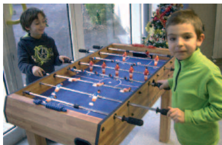
Bientôt un championnat de baby foot ?