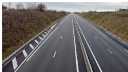
Aperçu à Cressanges du nouveau tronçon 2 x 2 voies.

Lors de son intervention Madame le Maire a bien rappelé à l'État l'importance de poursuivre les aménagements et surtout de créer une aire de services afin de proposer aux usagers de cette route des services essentiels au bon usage de cet axe et pour éviter de retrouver des camions stationner n'importe où dans la commune. En effet des dégâts importants ont été déplorés suite à des demi-tours inconsidérés, notamment lors des épisodes neigeux du début d'année 2011.