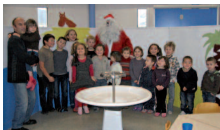
La barbe du Père Noël a bien poussé depuis l'année dernière.