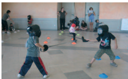
D'Artagnan et Aramis : palsembleu je vais vous occire mon ami...

Cette année encore, des cours d'escrime seront proposés aux enfants, tous les jeudis, à partir de 17 h 30, au centre socio culturel. Prévoir 80 euros d'inscription pour l'année. Les cours sont assurés par Monsieur Ferrando, maître d'arme (association des escrimeurs bourbonnais). Une compétition est prévue, comme en 2011, le 22 avril 2012.